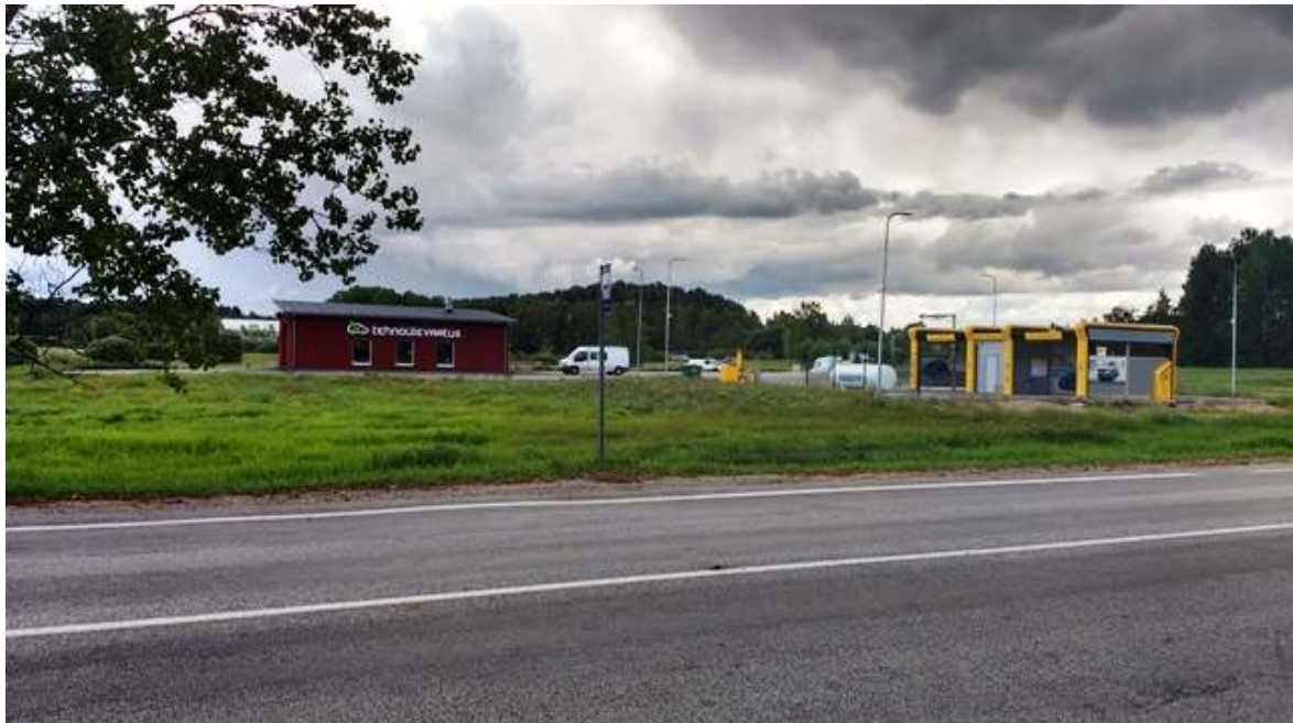
Foto 1. Vaade Väike-Veske maaüksusele loodest.

Planeeritav ala kannatab osaliselt liigniiskuse all, mistõttu on sinna rajatud maaparandusehitist KORTINA-4 (MPS kood/ehitise kood 2103680010020001).