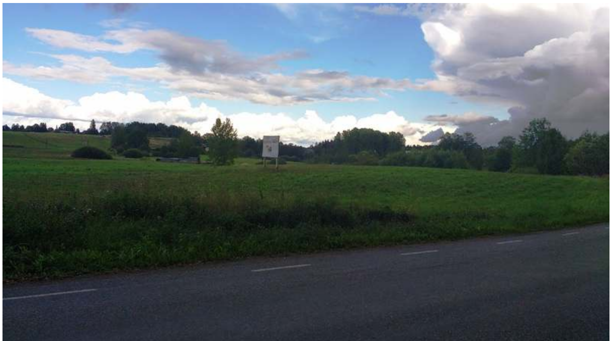
Foto 2. Vaade Kagumohni katastriüksusele lõunast.