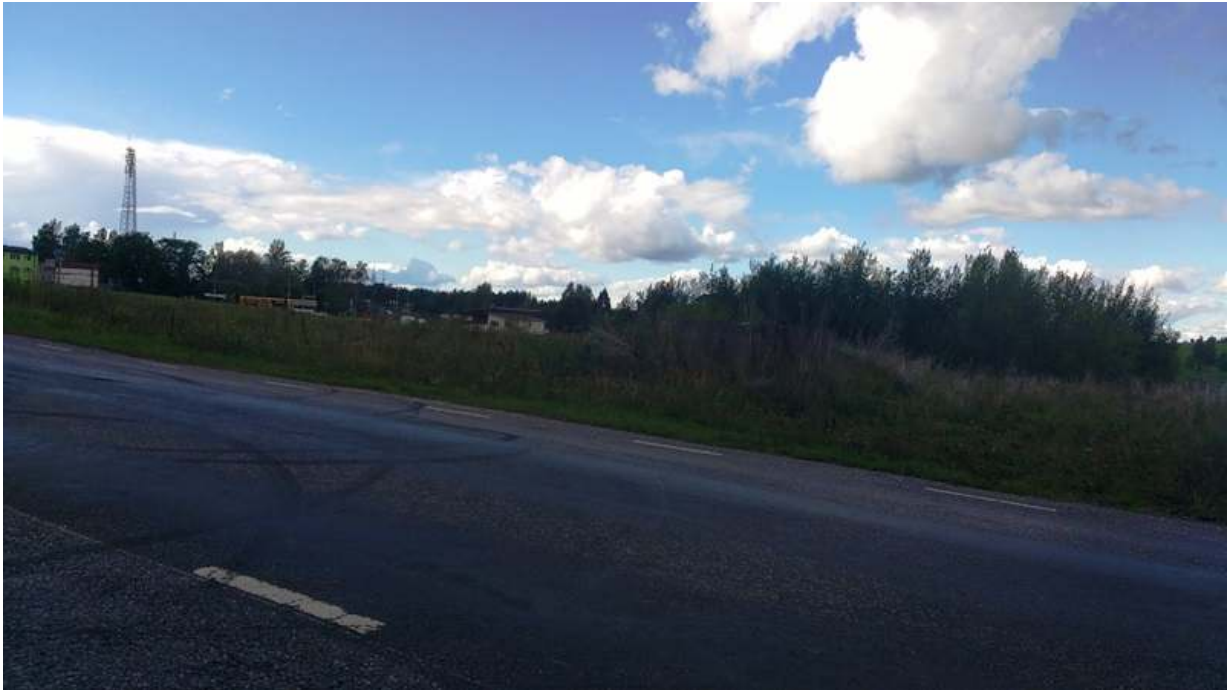
Foto 3. Vaade Ala-Veske katastriüksusele kagust.