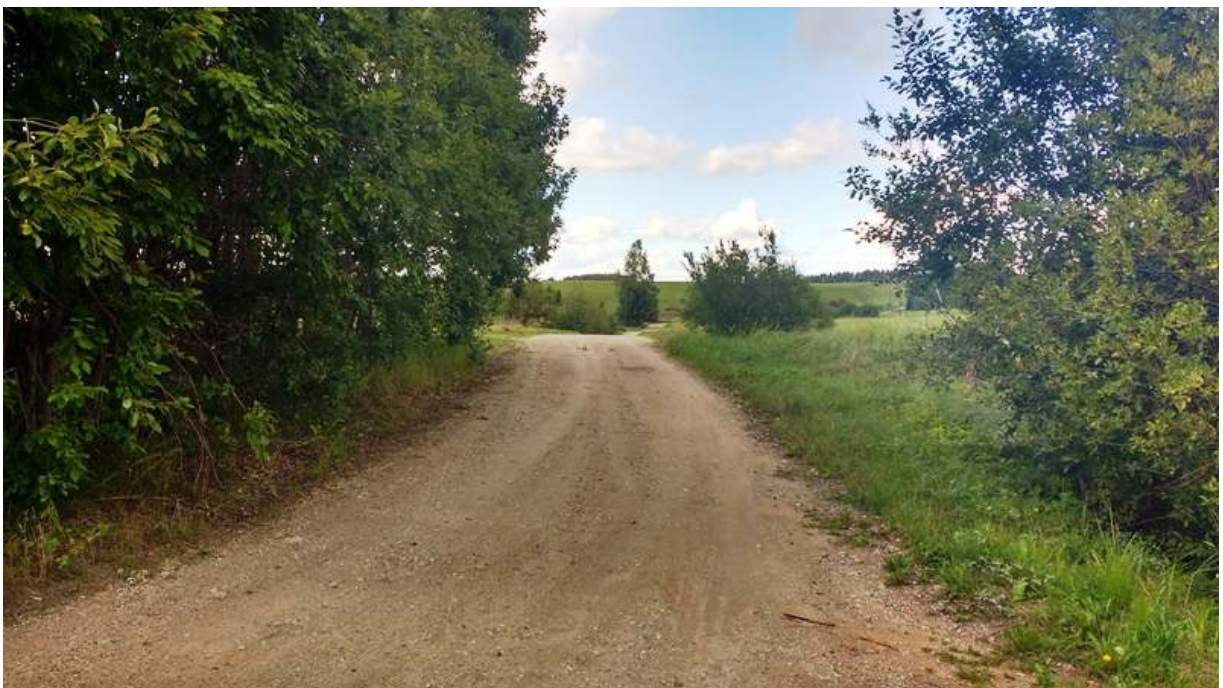
Foto 4. Vaade Otepää-Lüüsjärve teele lõunast.

Eelpooltoodud fotode pildistamise punktid on tähistatud graafilises osas joonisel „Olemasolev olukord“.